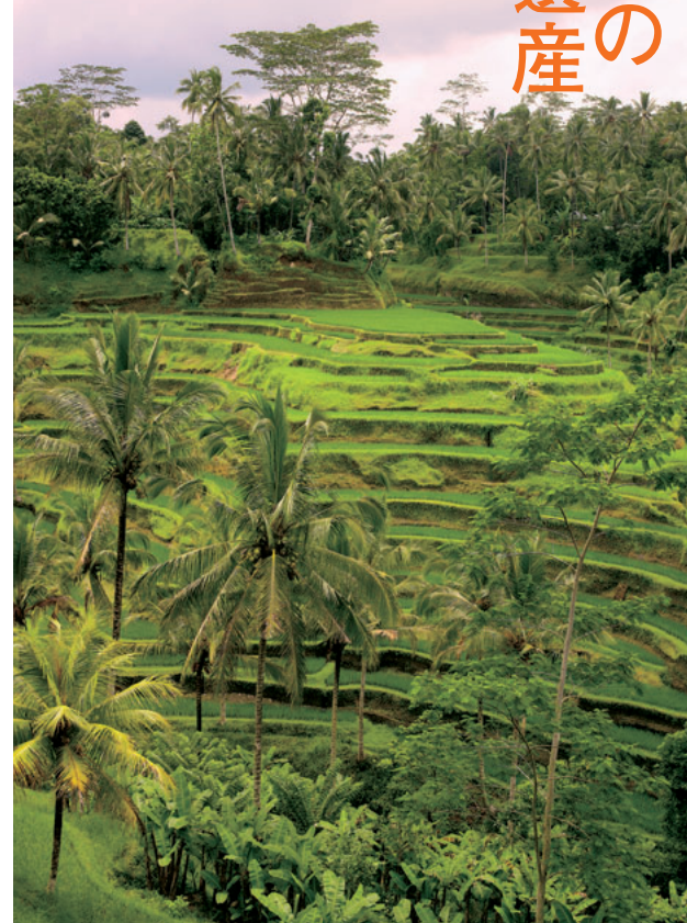
ウブド郊外やノットゥール湖周辺に広がる棚田風景。

今年6月、バリ島初の世界遺産が誕生。それがバリ伝統の水利システム「スバック」による棚田風景。バリ王では、心が癒やされる美しいバリの原風景を満喫できるツアーを豊富に用意。●料金／キンタマニ高原と伝統村ツアー¥4,500（約9時間）、タマンアユン寺院とタナロット寺院ツアー¥4,500（約7時間）、ウブド散策ツアー¥4,000（約8時間）