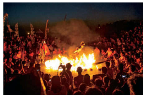
（右）夕陽に照らされるウルワツ寺院。（左）猛火の中で演者が踊り、盛り上がりも最高潮に！