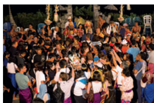
公演終了後は、出演者と記念撮影もOK。

バリの伝統舞踊のなかでも、特に人気が高いのがケチャ。10世紀に建立されたという聖地・ウルワツ寺院で毎夜行われる公演は、沈みゆく夕陽をバックに厳かにスタートし、その幻想的なロケーションもあって感動的。そして独特のリズムに陶酔して、終演のころには神秘的な踊りの虜に……。●料金／ウルワツ寺院とケチャファイヤーダンス鑑賞¥4,000（約6時間）