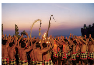
魔物除けの儀式が発展した伝統舞踊。